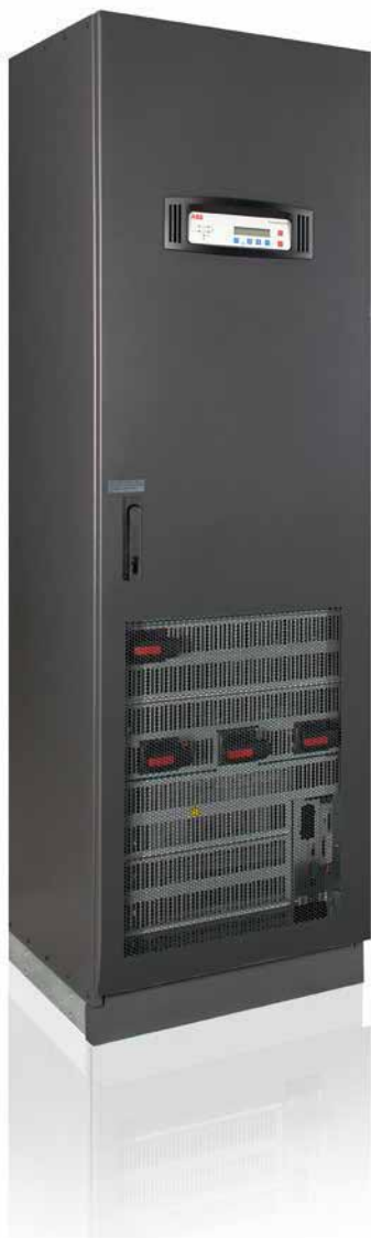
PowerWave 33 S3 60 - 120 kW